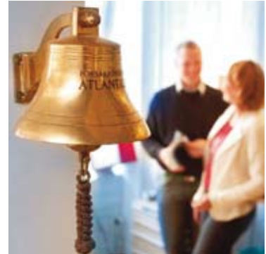
Försäkringsgivare till Atlantica Båtförsäkring är Moderna Försäkringar Sak AB org. nr 516406-0070 styrelsens säte: Stockholm

Är du osäker på vilket sätt som är bäst kan du få vägledning av oss eller Konsumenternas Försäkringsbyrå.